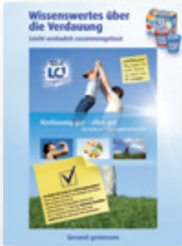
1/1 Seite Inserat mit aufgeklebtem Booklet von Nestlé

Unsere Erfahrungen belegen: Sonderinsertionen garantieren hohe Aufmerksamkeit zu günstigen 1'000er-Preisen: