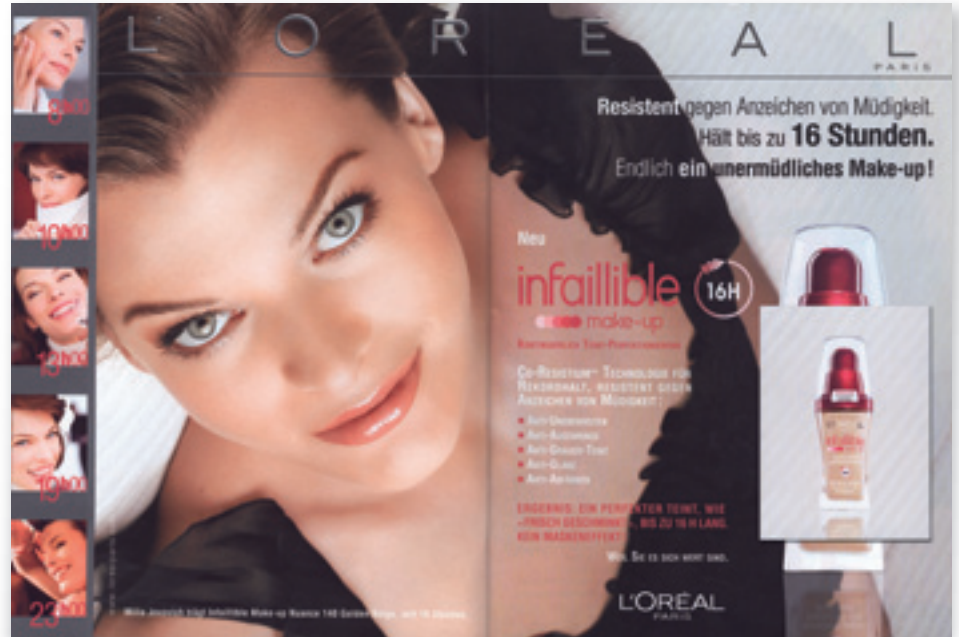
2/1 Seite Inserat (2. US/S. 3) mit aufgespendetem Warenmuster von L'Oréal Paris Infaillible