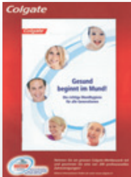
1/1 Seite Inserat mit aufgeklebtem Booklet von Colgate